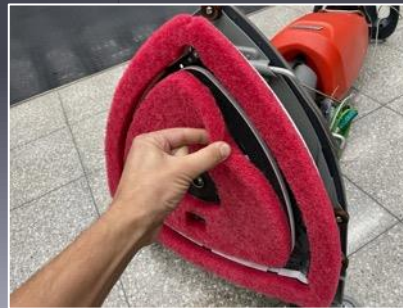
Werkzeugloses Wechseln von Bürsten und Pads