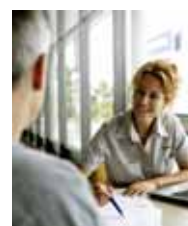
Volvo Financial Services