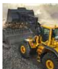
Volvo Construction Equipment